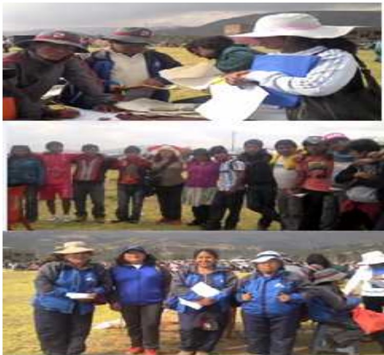
Día De La Familia Agustina, en compañía de los docentes, estudiantes y padres de