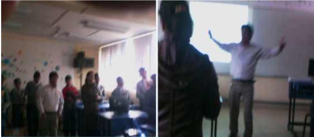
Taller de relaciones Interpersonales y liderazgo