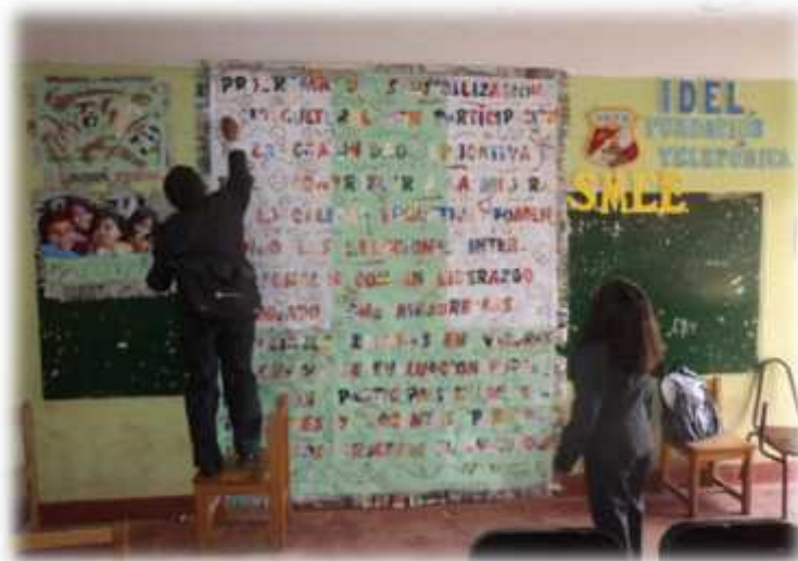
La profesora Rocío Cosquillo y otro docente mostrando afiches de reflexión, donde explicaron la importancia del buen clima institucional