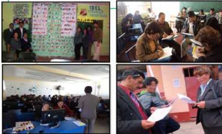
En estas fotos se evidencia la socialización de los grupos de reflexión de docentes