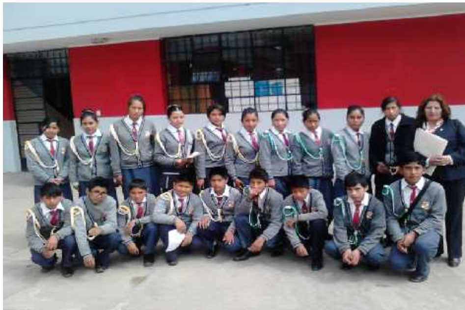
Fiscales que participaron en un taller de capacitación sobre Derechos Humanos en el Ministerio de Trabajo de Huancayo