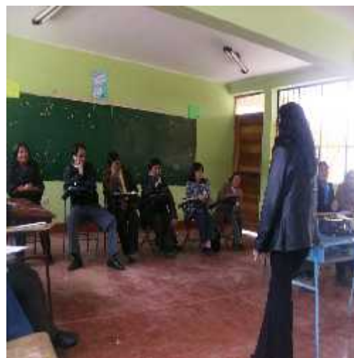
Talleres de reflexión y las charlas de sensibilización que se desarrollaron sobre relaciones interpersonales con la psicóloga de IDEL y Fundación Telefónica.