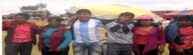
Día de la familia agustina 2015. Padres e hijos abrazados.