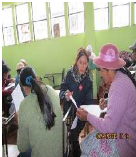
Recogiendo opinión de los padres de familia para el diagnóstico en el 2012.