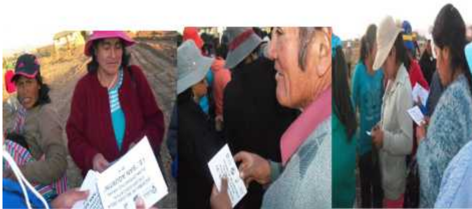
Padres de familia en el terreno Santa Rosa que se utilizó como espacio de reflexión sobre relaciones interpersonales.