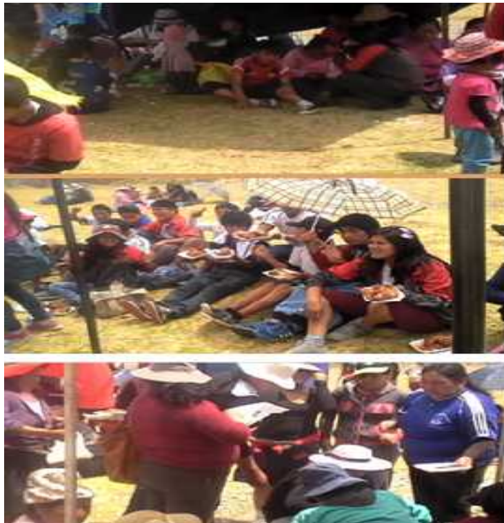
Las familias compartiendo el almuerzo en el día de la familia