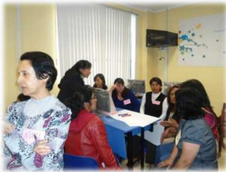
Uno de los taller de formulación del PEI